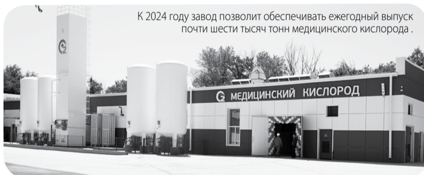
К 2024 году завод позволит обеспечивать ежегодный выпуск почти шести тысяч тонн медицинского кислорода.