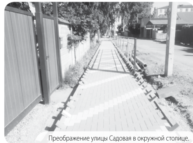
Преобразование улицы Садовая в окружной столице.

Благоустройство тротуаров в станице Ессентукской идёт благодаря губернаторской программе поддержки местных инициатив.