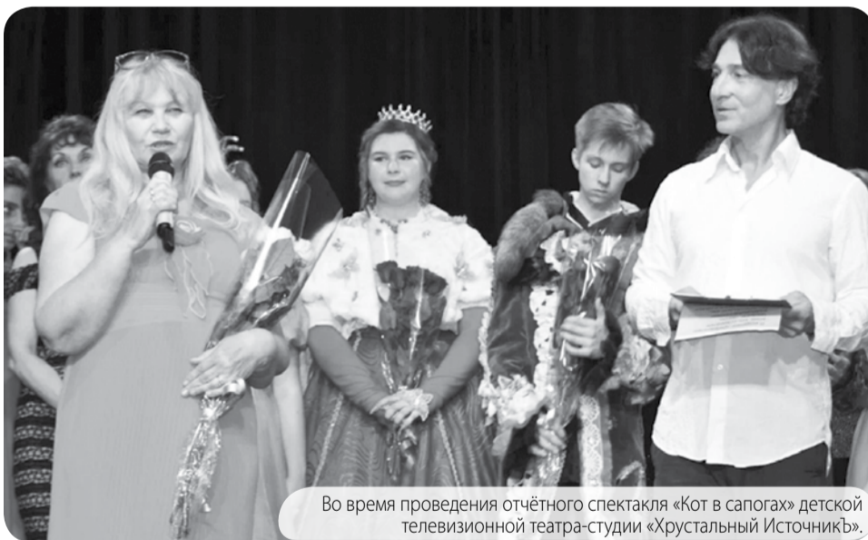
Во время проведения отчётного спектакля «Кот в сапогах» детской телевизионной театра-студии «Хрустальный Источник».

- При поступлении в театр-студию он читал отрывок из произведения Владимира Железнякова «Чучело», - рассказывает мама Артура. - Смог тогда преодолеть волнение на прослушивании и произвести на приёмную комиссию хорошее впечатление, поступить.