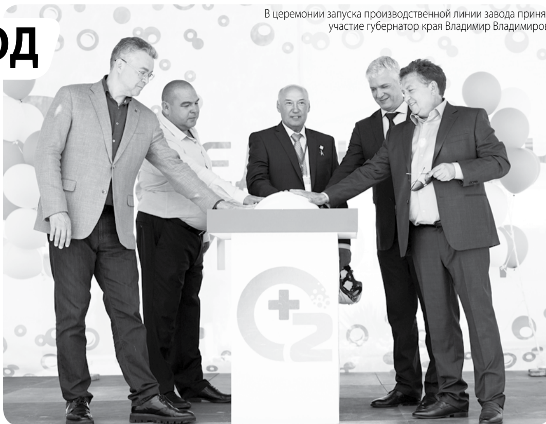
В церемонии запуска производственной линии завода принял участие губернатор края Владимир Владимирович.

В числе финансовых партнёров проекта выступил Фонд развития промышленности РФ, предоставивший на создание завода льготный кредит в размере 300 миллионов рублей. Техническую и инженерную сторону работ осуществили специалисты одной из ставропольских химических компаний.